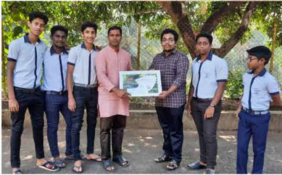
മാതൃഭൂമി സീഡ് കാഞ്ഞങ്ങാട് വിദ്യാഭ്യാസ ജില്ലാ ഹരിത വിദ്യാലയം ഒന്നാം സ്ഥാനം നേടിയ ചെറുപനത്തടി സെന്റ് മേരീസ് ഇംഗ്ലീഷ് മീഡിയം സ്കൂൾ

Organic vegetable garden is maintained. Plastic free campus is maintained by our Green Army volunteers. Students have prepared fish pond Vegetable garden etc..